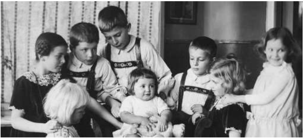
alle acht Kinder der Familie Bonhoeffer

In Erinnerung an den 7. Geburtstag der jüngsten Tochter Susanne haben wir einen Kreisel in Schwung versetzt.